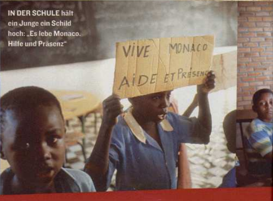
IN DER SCHULE hält ein Junge ein Schild hoch: „Es lebe Monaco. Hilfe und Präsenz“