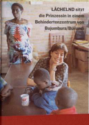
LÄCHELND sitzt die Prinzessin in einem Behindertenzentrum von Bujumbura/Burundi