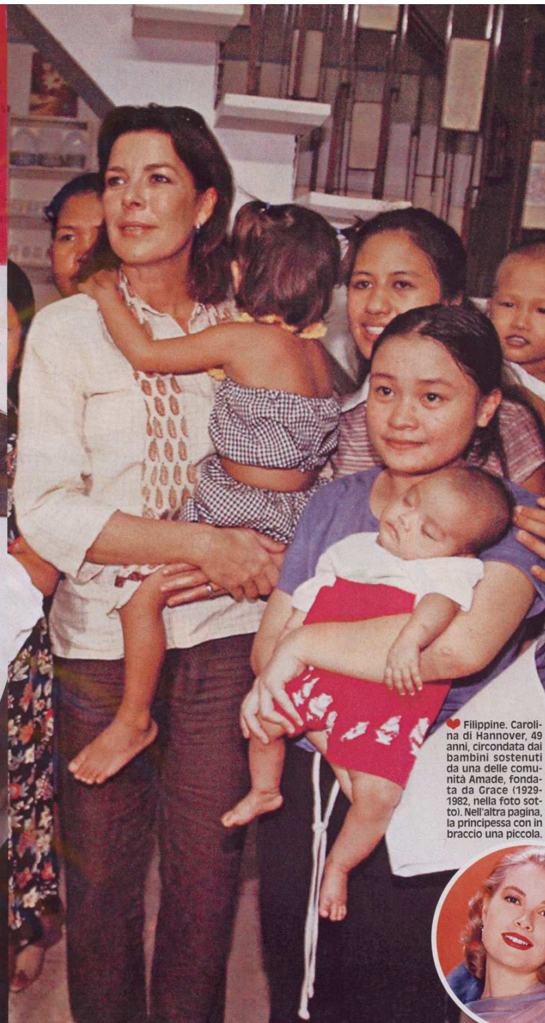
♥ Filippine. Carolina di Hannover, 49 anni, circondata dai bambini sostenuti da una delle comunità Amade, fondata da Grace (1929-1982, nella foto sotto). Nell'altra pagina, la principessa con in braccio una piccola.