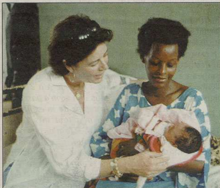
Sur le terrain, la princesse a pu constater les avancées de l'association de protection de l'enfance.

Au Niger, la première étape de la présidente de l'Amade mondiale fut l'inauguration d'une pharmacie spécialisée dans la drépanocytose, cette terrible maladie du sang qui touche un Nigérien sur cinq. Cette structure mettra à disposition des médicaments à prix réduits.