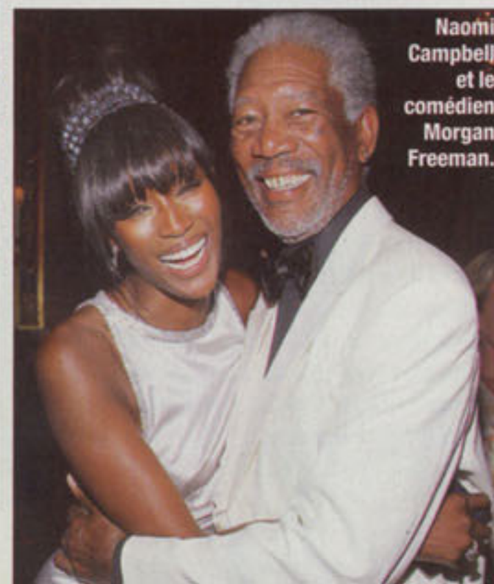
Naomi Campbell et le comédien Morgan Freeman.