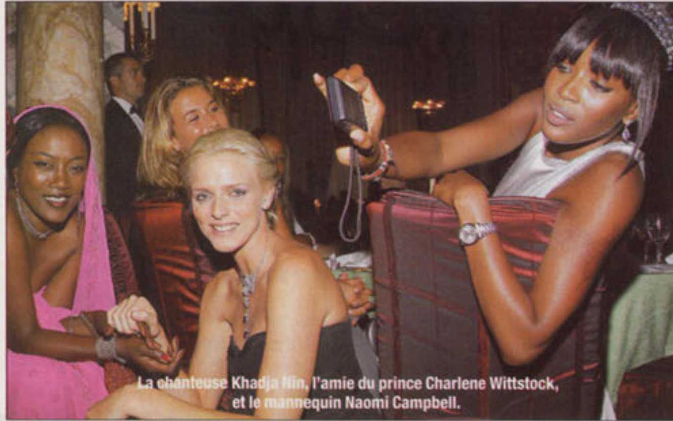
La chanteuse Khadja Nin, l'amie du prince Charlene Wittstock, et le mannequin Naomi Campbell.