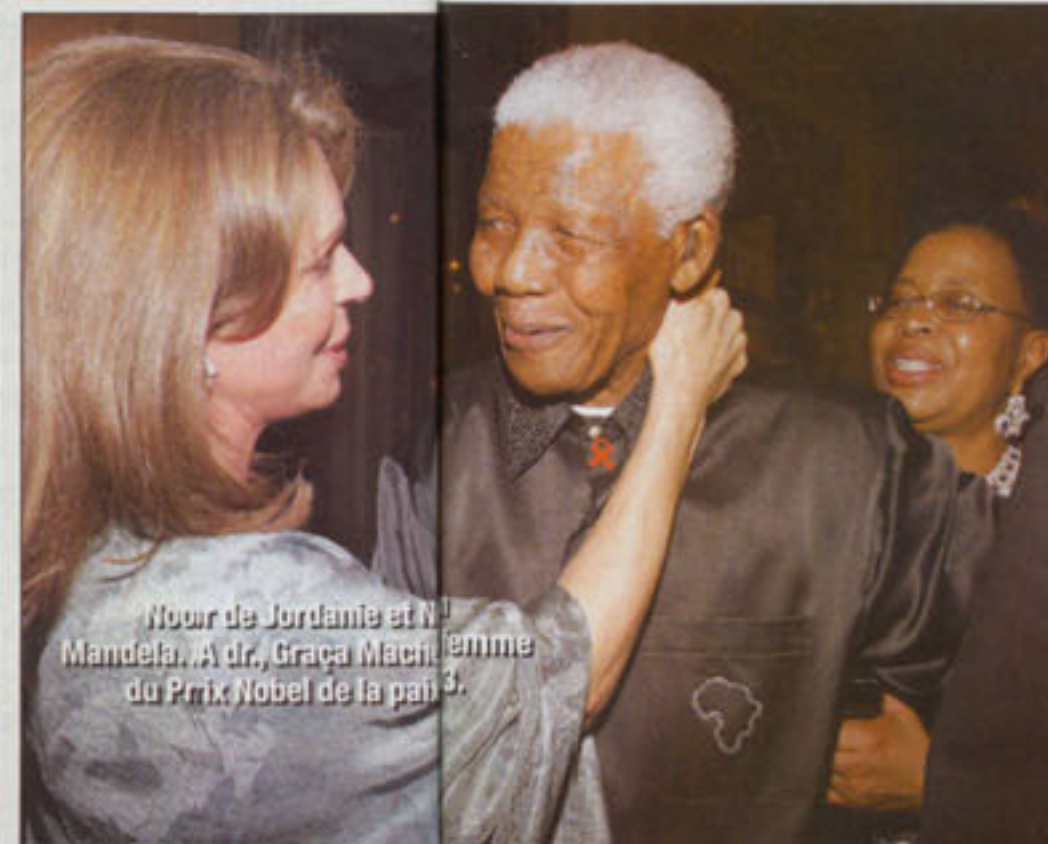
Nour de Jordanie et Nelson Mandela. A dr., Graça Machel, épouse du Prix Nobel de la paix.

Toutes les apparitions de Nelson Mandela, 89 ans, sont des événements. Dimanche 2 septembre, il honore de sa présence un dîner de gala organisé par le prince Albert de Monaco, auquel participent 350 convives qui ont chacun versé 3 500 euros. Une soirée au profit de l'Amade mondiale, présidée par Caroline de Monaco, et de trois fondations parrainées par l'ancien président sud-africain : Nelson Mandela Foundation, Nelson Mandela Children's Fund et Mandela Rhodes Foundation. La vente aux enchères, menée par Sotheby's, a permis de récolter 1,2 million d'euros.